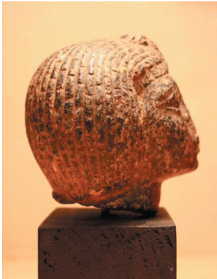
Рис. 2. Вид справа.