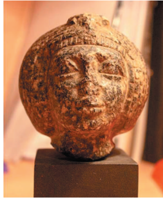
Рис. 1. Головка анонимной царицы. ГМИИ (Инв. № I, 1а 5355).