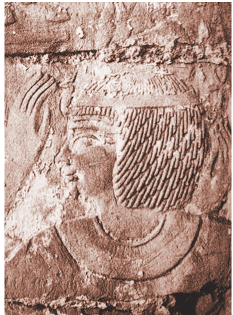
Рис. 8. Шепенупет I. Рельеф в святилище Осириса-хека-джет. Карнак (по: Мусливиев К. Royal Portraiture of the Dynasties XXI–XXX . Mainz: Philipp von Zabern, 1988. Pl. XXVI d).