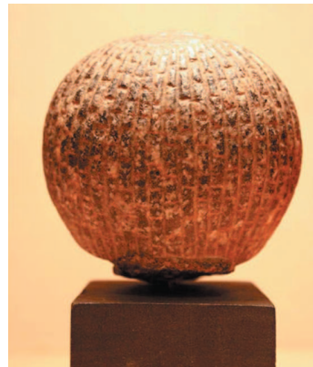
Рис. 5. Вид сверху.