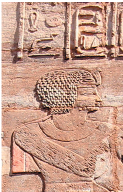
Рис. 9. Аменирдис I. Рельеф в святилище Осириса-хека-джет. Карнак.