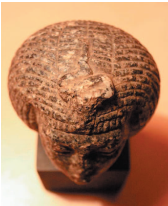
Рис. 4. Вид сзади.