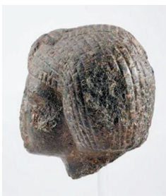
Рис. 12. Вид слева.