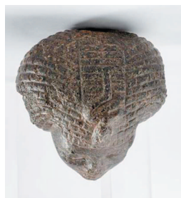
Рис. 13. Вид сзади.