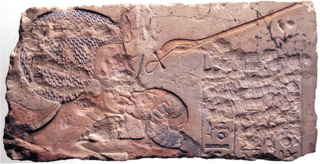
Рис. 6. Блок из Гермополя с изображением Нефертити. Нью-Йорк, Бруклинский музей (Инв. № 60.197.8). Block from Hermopolis with the image of Nefertiti. New York, Brooklyn Museum (Inv. № 60.197.8). https://www.brooklynmuseum.org/opencollection/objects/3700 (дата обращения: 27.01.2020)