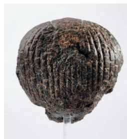
Рис. 14. Вид сверху.