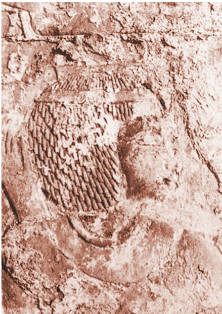
Рис. 7. Шепенупет I. Рельеф в святилище Осириса-хека-джет. Карнак (по: Мусливиев К. Royal Portraiture of the Dynasties XXI–XXX . Mainz: Philipp von Zabern, 1988. Pl. XXVI c).