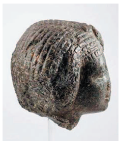
Рис. 11. Вид справа.