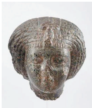
Рис. 10. Головка анонимной царицы. Ганновер, Музей А. Кестнера (Инв. № 1935.200.12). опубликовано с любезного разрешения музея.